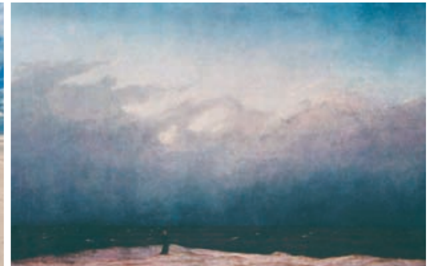
Schon Der Mönch am Meer von Caspar David Friedrich blickte sehnsüchtig zum Horizont. Die Hoffnung, dahinter liege das Glück, empfinden viele auch heute noch.

Zudem rückt bei Senioren wieder die Familie in den Sehnsuchtsfokus, was verständlich erscheint – mit dem Umbruch der Berentung sinnieren Menschen fast zwangsweise über neue Lebensinhalte. Genauso sehnen sich Senioren nach Gesundheit, während im jungen und mittleren Alter Ausbildung und Arbeit bei den Sehnsüchten weit oben stehen.