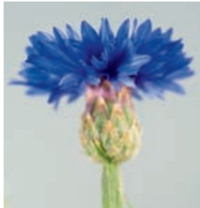
In jedem Feld zu finden und doch un-erreichbar: Bei der blauen Blume, dem Gegenstand romantischer Sehnsucht, könnte es sich um die Kornblume handeln.

► Sehnsucht speist sich aus sechs Komponenten, die verankert sind in der Lebensspannen-Psychologie und der deutschen Kulturgeschichte, etwa in Malerei und Literatur.