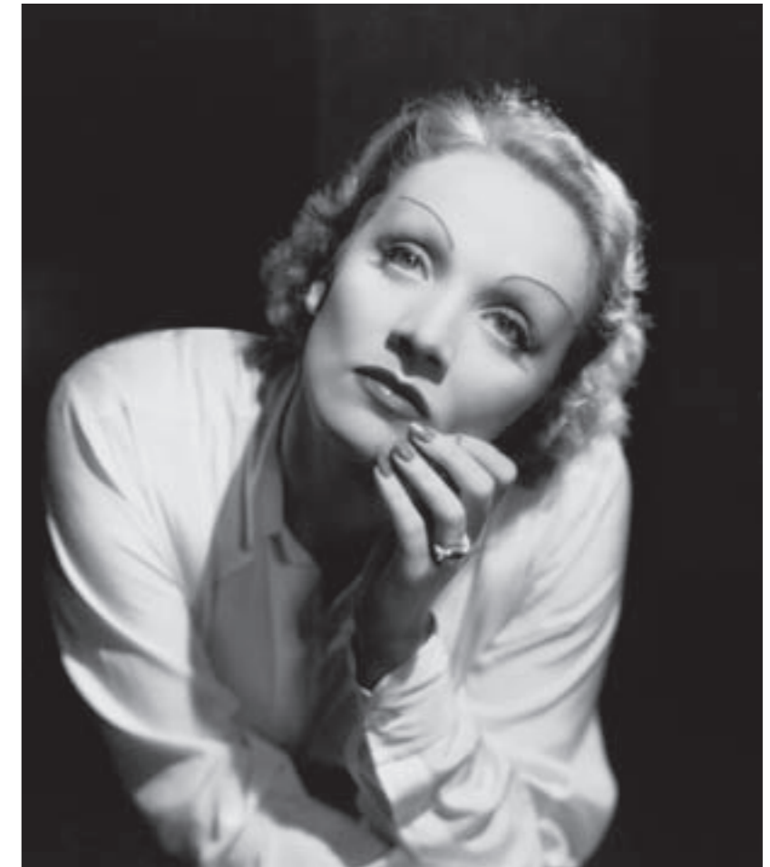
Ihren sehnsüchtigen Blick richtet Marlene Dietrich als „Madeleine de Beaupré“ im Film Desire erst auf ein Perlen-Collier, dann entdeckt sie ihr Verlangen für Gary Cooper alias Tom Bradley.

► Emotionale Ambivalenz: In der Sehnsucht vereinen sich positive Gefühle in Form der erstrebenswerten Objekte und Zustände und negative Gefühle, weil das Ersehnte nicht realisierbar ist oder realisierbar erscheint. Beides erzeugt die typische bittere Süße. („Ich genieße